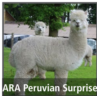
ARA Peruvian Surprise

Sie wird garantiert eine sehr gute und unkomplizierte Zuchtstute.