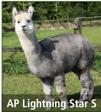
AP Lightning Star S

Passend dazu haben wir unsere Hengstgruppe um einen grauen Top-Deckhengst erweitert: