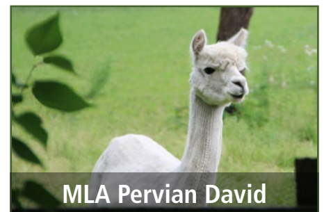
MLA Peruvian David

Weiterhin steht selbstverständlich auch unser Hemingway Enkel MLA Peruvian David für Gaststuten zur Verfügung. Über David muss eigentlich nicht mehr viel gesagt werden. Er ist eine Wucht und seine Nachkommen lassen das Züchterherz wirklich höher schlagen. Hier gibt es viele weitere Informationen über David.